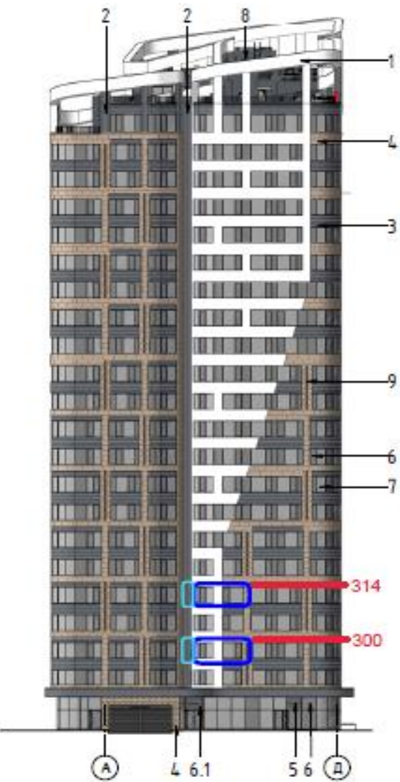
Схема предполагаемых мест размещения корзин под внешние блоки кондиционеров в многоквартирном доме по адресу: г. Москва, пр-д Невельского, д.3 корп.2 со стороны пр-д Невельского, д.6 корп.2.